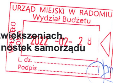
Tabela 1.5 Odpisy aktualizujące wartość należności, ze wskazaniem stanu na początek roku obrotowego, zwiększeniach, wykorzystaniu, rozwiązaniu i stanie na koniec roku obrotowego, z uwzględnieniem należności finansowych jednostek samorządu terytorialnego (stan pożyczek zagrożonych)